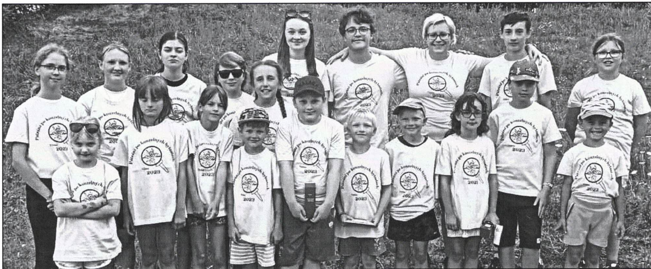
TÁBORNÍCI. Účastníci příměstského tábora, který se na konci července konal ve Vižině.

Informační měsíčník obce pod Skálou a brdskými Hřebeny 8/2023 (42)