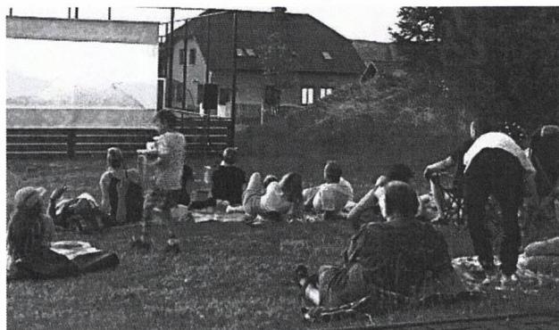
V LETŇÁKU. Promítání letního kina přilákal do sportovního areálu ve Vižině rekordní počet diváků.