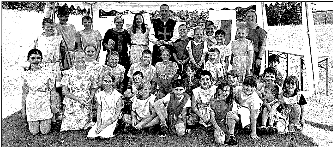
V DUCHU RYTÍŘSKÝCH CTNOSTÍ. Účastníci příměstského »středověkého« tábora, který se konal ve Vižině.

Informační měsíčník obce pod Skálou a brdskými Hřebený 8/2022 (29)